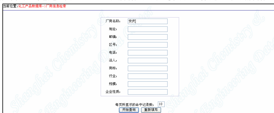
图 3.2.17.7 根据厂商名称检索（例 2）

2) 厂商信息检索 厂商信息包括厂商名称、地址、法人、商标等多种信息，可以组合，默认模糊匹配。如在厂商名称栏里输入“安庆”（例 2），则所有名称中含有“安庆”的企业都被检出。如图 3.2.17.8 中，点厂商名称的连接可查看厂商的基本信息（图 3.2.17.9），点所有产品的连接可以查看该厂生产的所有产品（图 3.2.17.10）。