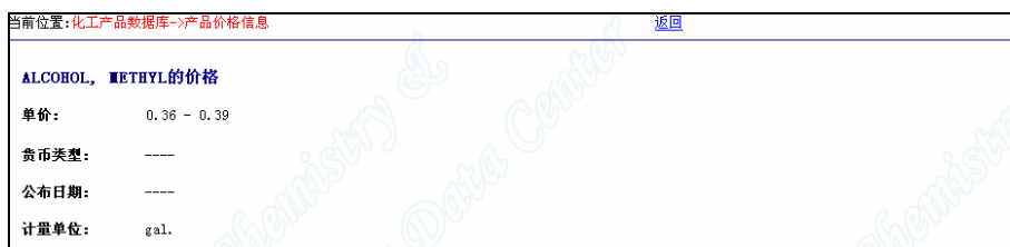
图 3.2.17.6 产品的价格信息

2) 厂商信息检索 厂商信息包括厂商名称、地址、法人、商标等多种信息，可以组合，默认模糊匹配。如在厂商名称栏里输入“安庆”（例 2），则所有名称中含有“安庆”的企业都被检出。如图 3.2.17.8 中，点厂商名称的连接可查看厂商的基本信息（图 3.2.17.9），点所有产品的连接可以查看该厂生产的所有产品（图 3.2.17.10）。