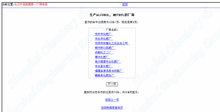
图 3.2.17.5 产品的生产厂商列表